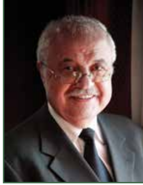
رئيس المنظمة سعادة الدكتور طلال أبوغزاله